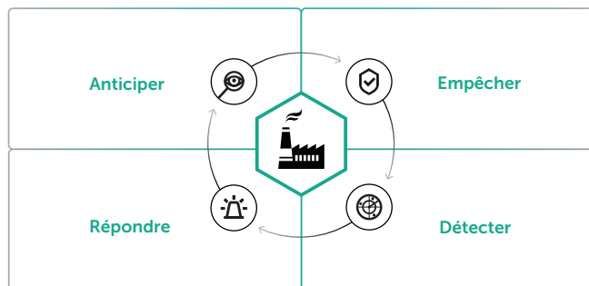
L'architecture de sécurité évolutive

En accord avec la stratégie de sécurité globale multi-niveaux de Kaspersky Lab, Kaspersky Industrial CyberSecurity fournit une combinaison de plusieurs méthodes de protection. Pour garantir de manière optimale la continuité et le fonctionnement sécurisé de votre entreprise, vous devez adopter une approche de la cybersécurité industrielle globale, de la prévision des vecteurs d'attaques potentielles grâce aux technologies de prévention et de détection industrielles spécialisées, à la neutralisation proactive d'un cyberincident.