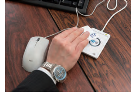
総務省が示した方針に対応し、アンチウイルス製品の見直しや、ICカードによる2要素認証の導入を進めている