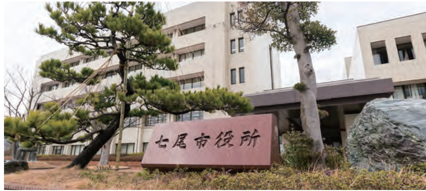
石川県の北部、能登半島の中央に位置する七尾市。庁内では、総合行政ネットワーク(LGWAN)環境のセキュリティ対策にも力を入れている

総務省の方針により、自治体の基幹系システムとインターネットの分離が進んでいる。新たな情報セキュリティ対策が必要となる中で、七尾市はアンチウイルス製品をリプレース。世界最高レベルの保護性能、高い利便性・経済性を備えたカスペルスキー製品の導入を決めた。