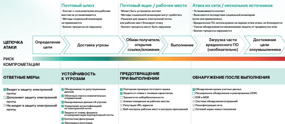
Роль защиты электронной почты на различных этапах цепочки поражения

Масштабируемая кластерная архитектура Kaspersky Secure Mail Gateway позволяет расширять возможности защиты по мере необходимости. Вам не придется жертвовать производительностью, чтобы поддерживать высокий уровень безопасности электронной переписки вашего растущего бизнеса.